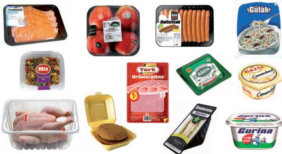
Plastikozko bandejak, oinarriak eta barketak (hestekiak, fruta, barazkiak, arrainak, sandwichak...). Tarrinak eta kutxatilik Bandejas, bases y barquetas de plástico (embutidos, fruta, verdura, pescados, sandwich...). Tarrinas y estuches