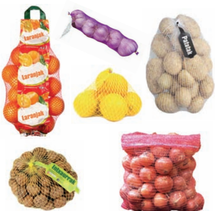
Sarea, fruta (laranja, limoi...) eta barazkientzat (patata, tipula, baratzi...) Malla para fruta (naranjas, limones...) y hortalizas (patata, cebollas, ajos...)