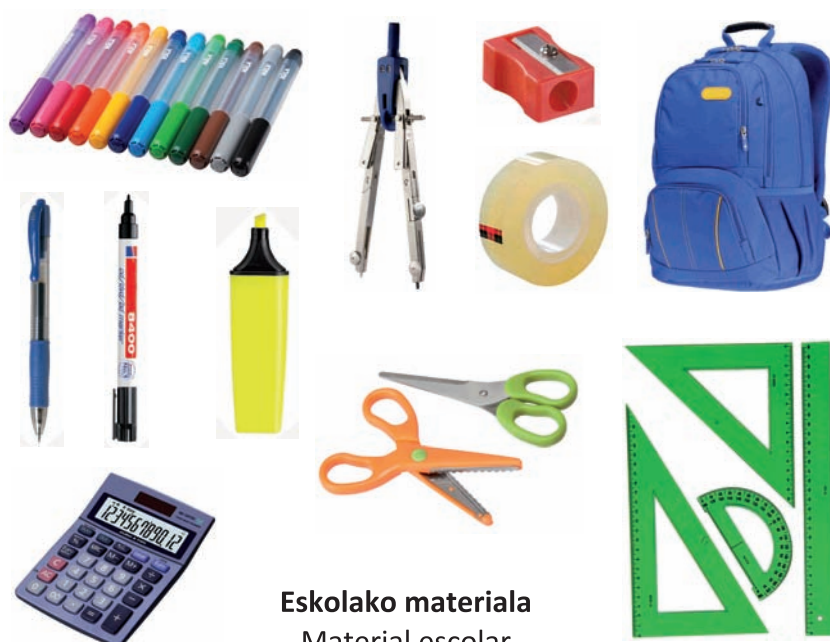
Eskolako materiala Material escolar