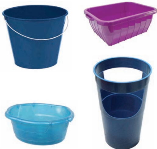
Ontzi, pertz, aterki-ontzia... Cubo, palangana, paragüero...