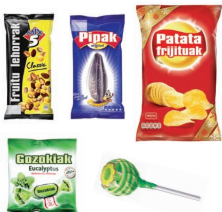
Litxarkerientzako poltsak. Txupatxusen makiltxoak eta bilgarria Bolsas de chuches. Palito y envoltorio del chupa chus