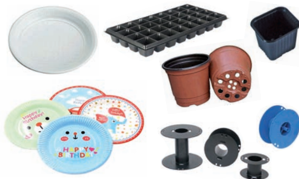
Erabilera bakarreko plastikozko ontziteria. Hari-txirrikak eta kableentzako harila txikiak. Landareak transplantatzeko plastikozko loraontzi txikiak.