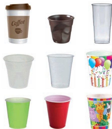
Kafe edo edarientzako plastikozko edalontziak Vasos de plástico para café o bebidas