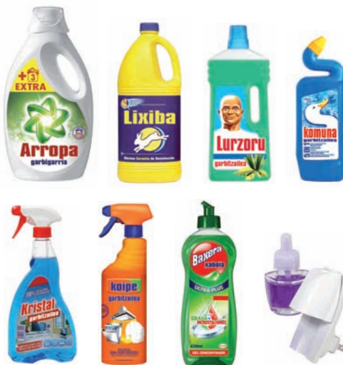
Garbigarrientzako ontziak. Entxufatzen diren giroitzaileak Envases de productos de limpieza. Ambientadores enchufables