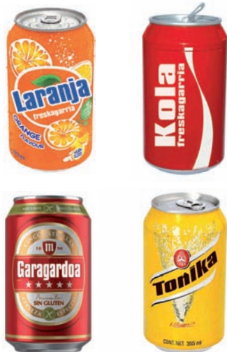
Garagardo eta freskagarrientzako latak Latas de cerveza y refrescos