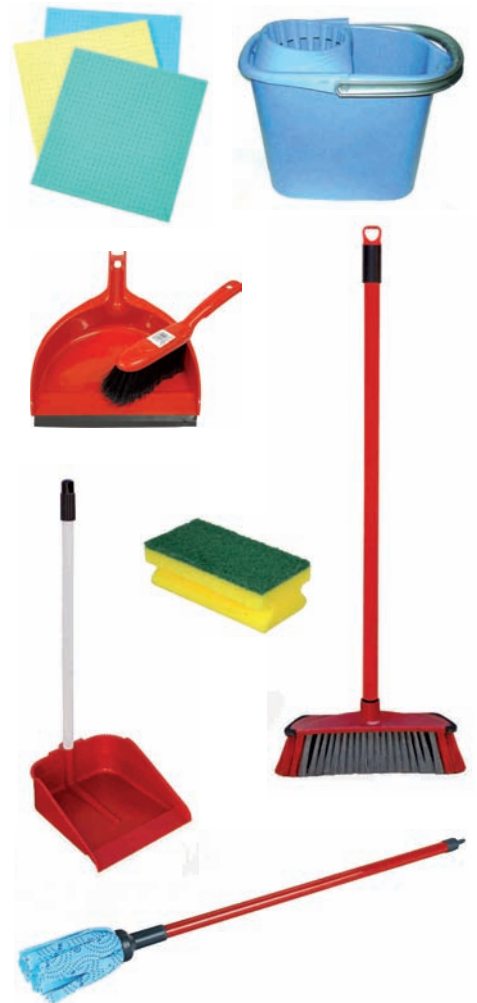
Erratza, zoru-garbigailua, zikinkeria jasotzeko pala, baieta, espartzua...