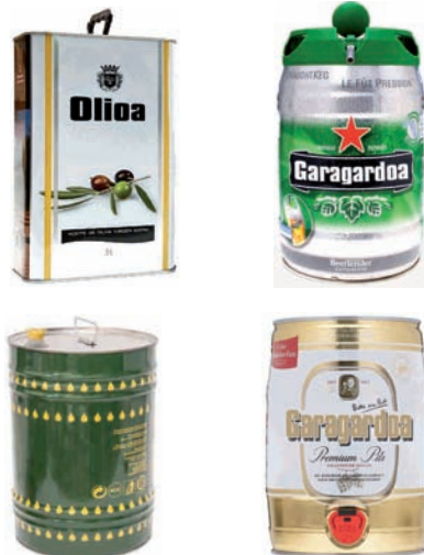
Bidoi edo garrafa metalikoak (olioa, garagardoa) Bidón o garrafa metálica (aceite, cerveza)