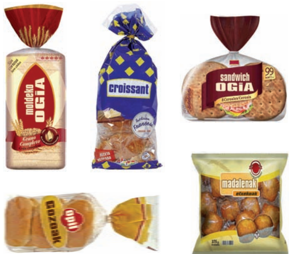
Opildegia industrialentzako poltsa eta zakuak Bolsas y sacos de bollería industrial