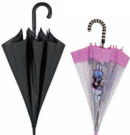
Pertxak, aterkiak.. Perchas, paraguas...