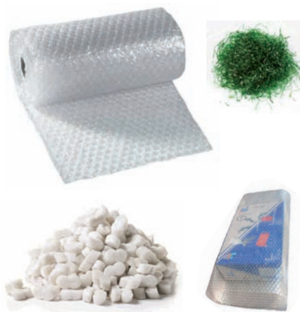
Plastiko burbuiladuna. Betetzeko eta babesteko plastikoak Plástico de burbujas. Plásticos de relleno y protección