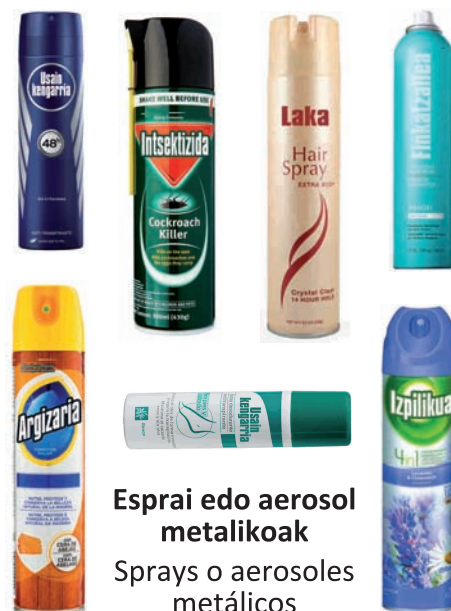
Esprai edo aerosol metalikoak Sprays o aerosoles metálicos