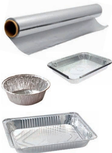
Aluminiozko bandejak. Aluminiozko papera Bandejas de aluminio. Papel de aluminio