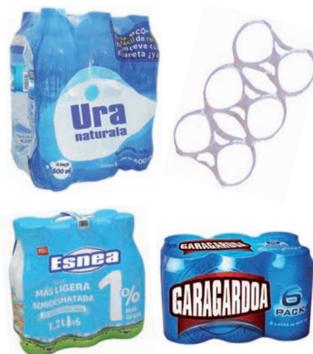
Edari sorten bilgarriak eta eraztunak Envolturas y anillas de packs de bebidas