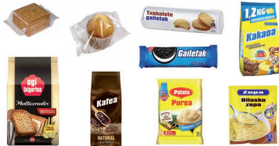
Magdalena, gaileta, ogi xigortu eta okintzako produktuentzako bilgarriak. Zopa edo patata purearentzako zorroak. Kakaorako pakete malguak Envoltorios de magdalenas, galletas, pan tostado y otros productos de panadería. Paquete flexible para cacao. Sobres para sopa, puré de patatas...