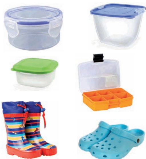
Tuperrak, gomazko oinetakoak Túpers, calzado de goma