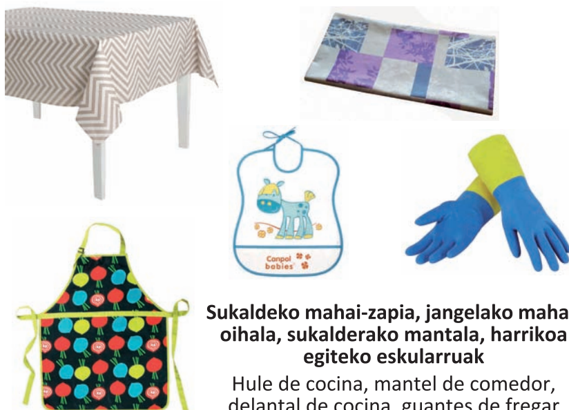
Sukaldeko mahai-zapia, jangelako mahai-oihala, sukalderako mantala, harrikoa egiteko eskularruak Hule de cocina, mantel de comedor, delantal de cocina, guantes de fregar