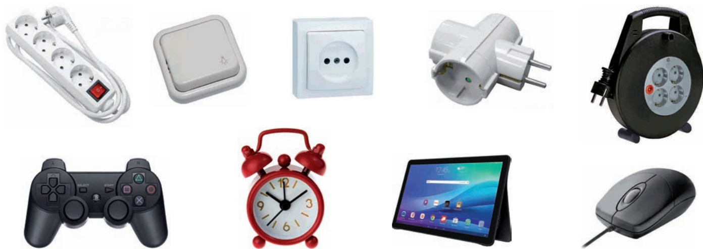
Luzagarria, erregeleta, entxufea, ordenagailuko xagua, tableta, playko urrutiko agindua, iratzargailua Alargador, regleta, enchufe, ratón del ordenador, tablet, mando play, despertador