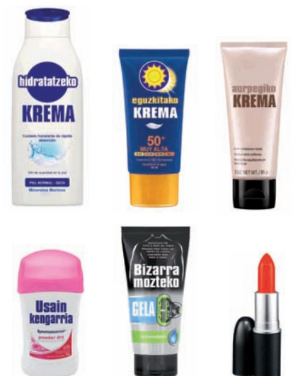
Zaintze pertsonalerako produktuen ontziak Envases de productos para el cuidado personal