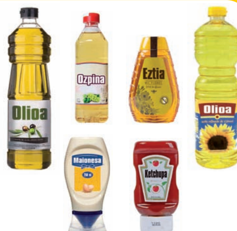
Olio, ozpin, eztiarentzako... plastikozko botilak Botellas de plástico para aceite, vinagre, miel...