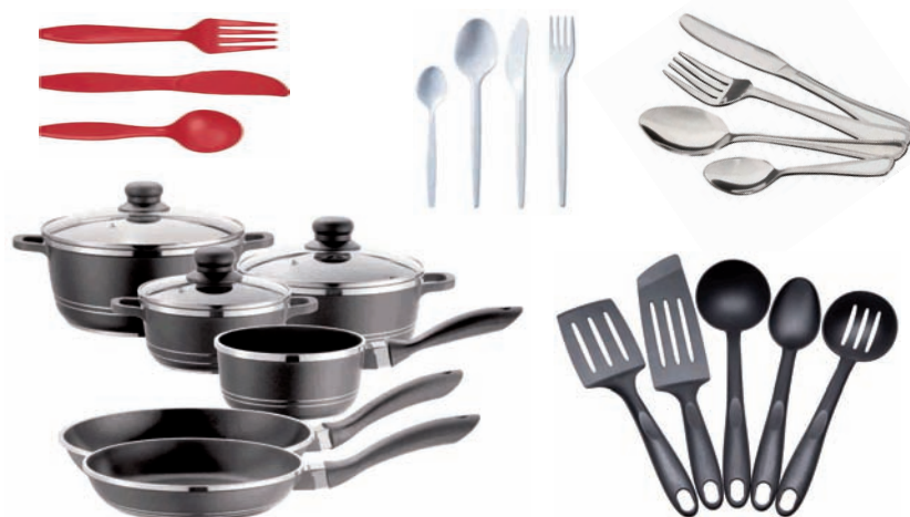
Sukaldekoak (zartagiak, lapikoak...). Plastikozko eta metalezko mahai-tresnak Menaje y utensilios de cocina (sartenes, cazuelas...). Cubiertos de plástico y metálicos