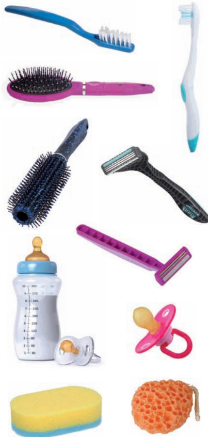
Hortzetako eskuila, ilearentzako eskuila, bizar-aitzurra, depilazio-aitzurra, biberioia, txupetea, esponja...