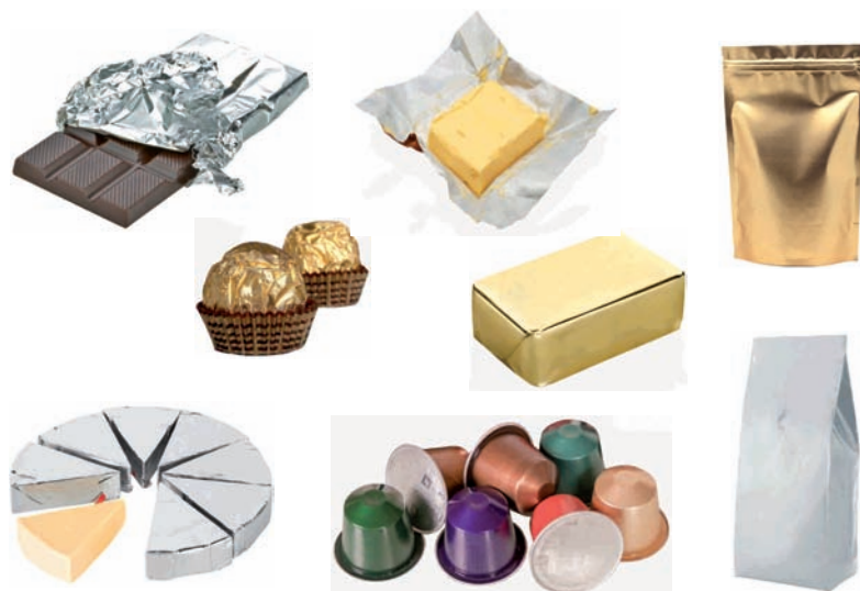
Aluminiozko bilgarriak. Kafearentzako kapsulak (hutsik!) Envoltorios de aluminio, Cápsulas de café (¡vacías!)