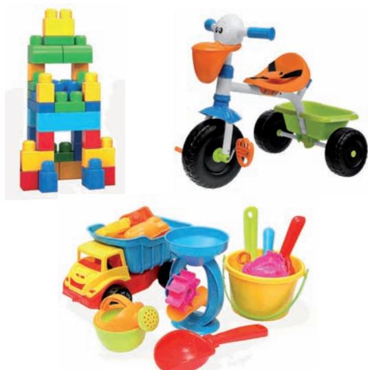
Puskatutako jostailuak, hondartzako kuboa Juguetes rotos, cubo de playa