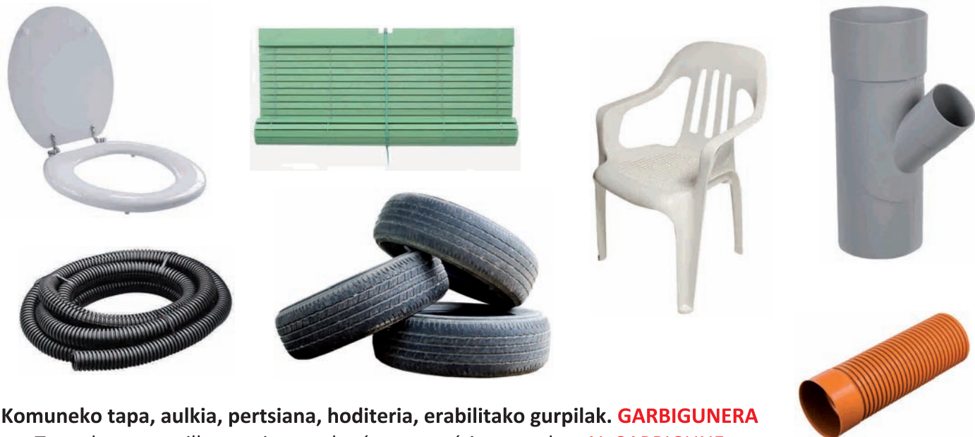
Komuneko tapa, aulkia, pertsiana, hoditeria, erabilitako gurpilak. GARBIGUNERA Tapa de water, silla, persiana, tuberías, neumáticos usados. AL GARBIGUNE