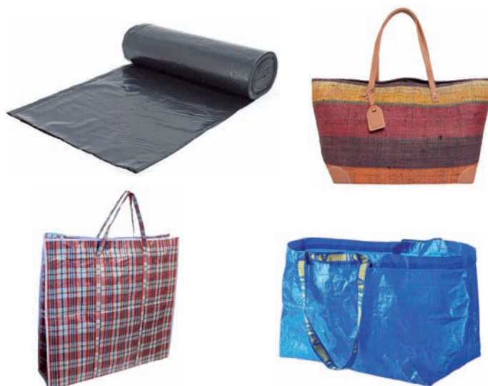
Zabor-poltsak, errafiazko poltsak Bolsas de basura, bolsas de rafia