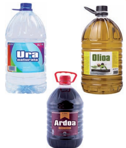
Garrafak eta bidoiak: ura, olioa, ardoa... Garrafas y bidones: agua, aceite, vino...