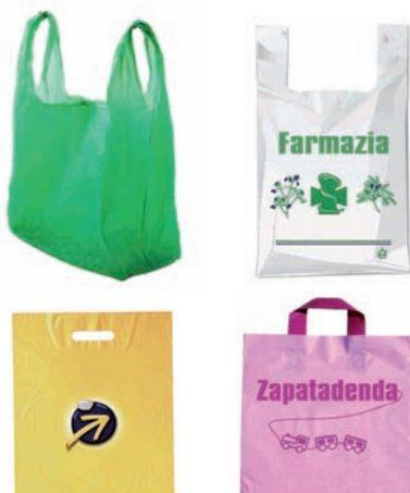
Komertzioetan emandako plastikozko poltsak Bolsas de plástico entregadas por comercios