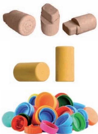
Plastikozko tapoi eta kortxoak Taponos y corchos de plástico