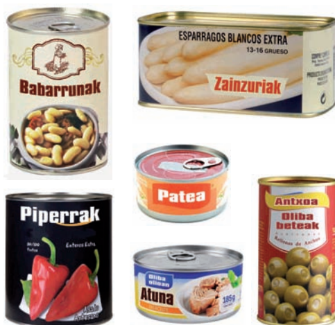
Kontserba-latak (olibak, atuna, zainzuriak, lekaleak...) Latas de conserva (aceitunas, atun, esparragos, legumbres...)