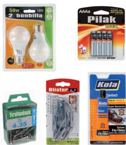
Plastikozko blisterrak, burdindegi, pila, bonbilentzat... Blíster de plástico para productos de ferretería, pilas, bombillas...