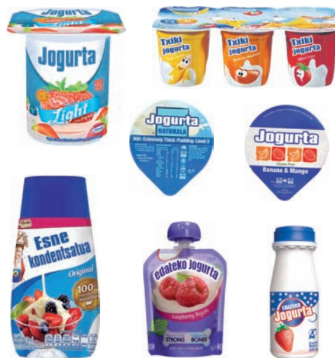
Yogurt-ontziak (tapa ere bai) eta esnekientzako ontziak Envases de yogurt (la tapa también) y de lácteos