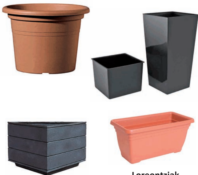
Loreontziak Tiestos, maceteros