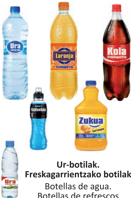
Ur-botilak. Freskagarrientzako botilak Botellas de agua. Botellas de refrescos

plastikozko ontziak ✓ envases de plástico