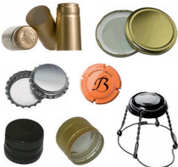
Tapa, kapsula eta sare metalikoak. Txapak Tapas, cápsulas y rejillas metálicas. Chapas