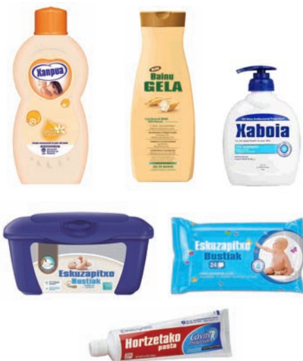
Higiene pertsonala: xanpu, gel, xaboi, hortzetako pasta... Higiene personal: gel, champú, jabón, pasta de dientes...