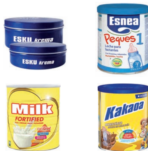
Beste pote metaliko batzuk (eskutarako krema, haurrentzako esnea...) Otros botes metálicos (crema de manos, leche infantil...)